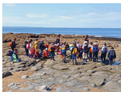
Séjour de mer à Préfaïlles. CP et CE1 en mai.