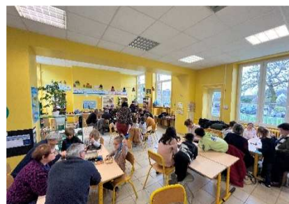
Temps de jeux avec les grands-parents

Ecole Maternelle et Élémentaire de Livré-La-Touche