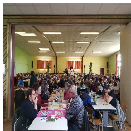
Loto organisé par L'A.P.E.L