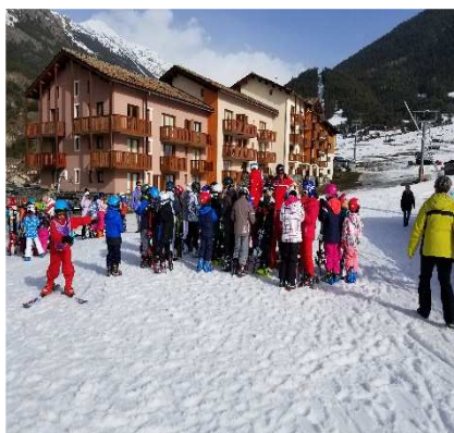
Classe de neige pour les CE2 - CM1 - CM2